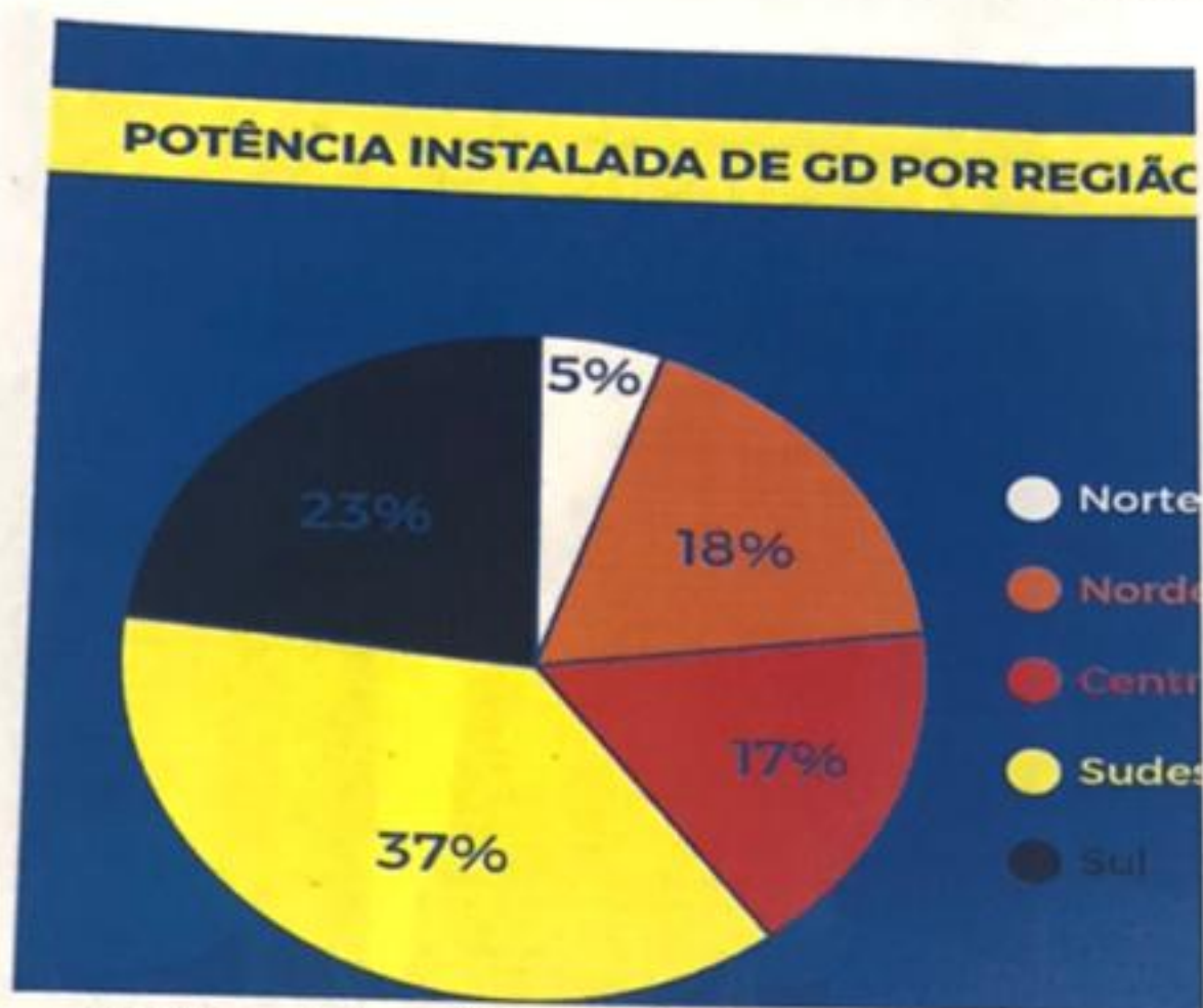
Gráfico elaborado com dados da Fonte Aneel