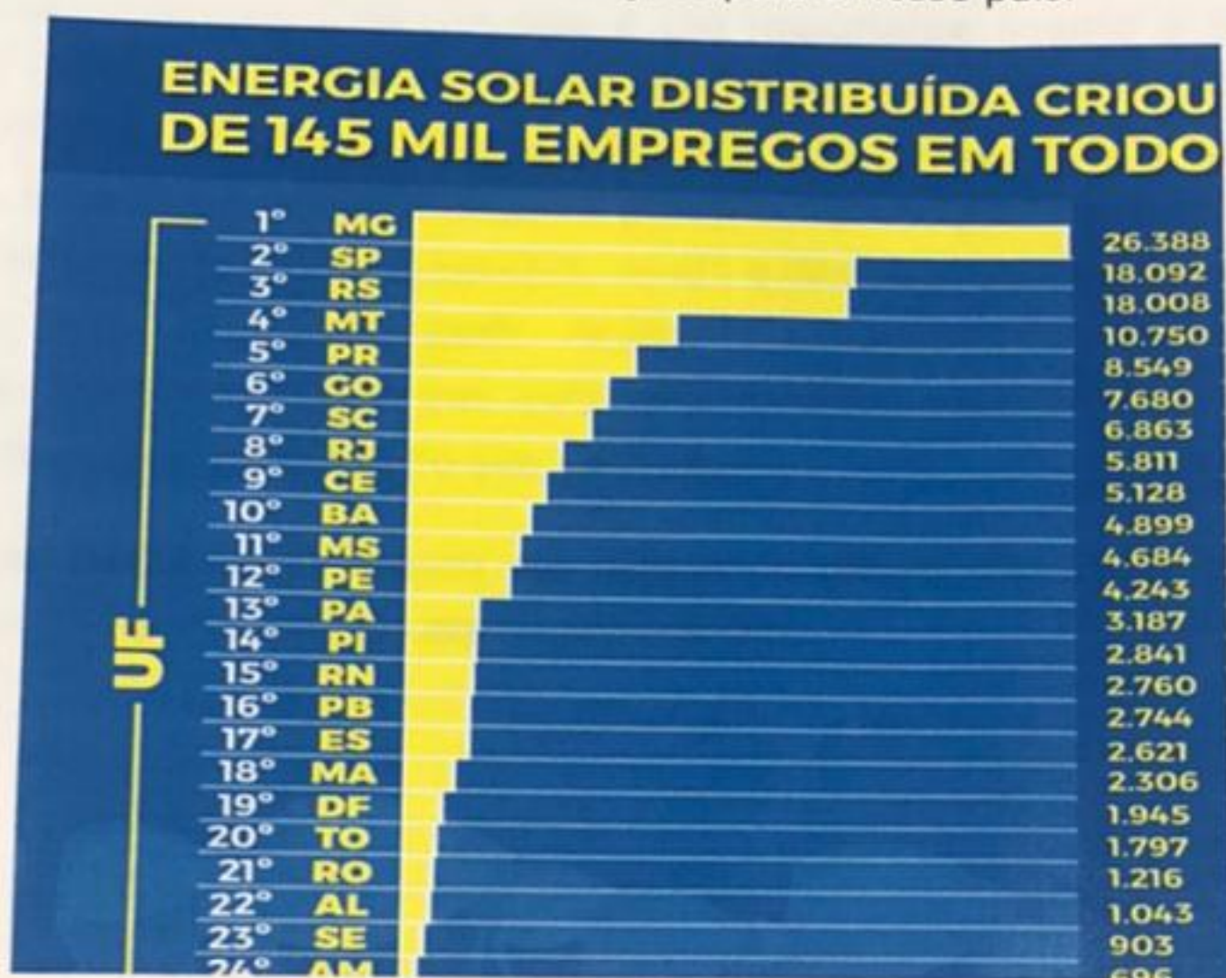
Gráfico elaborado com dados das Fontes Aneel e EPE