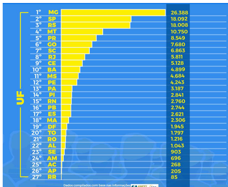
Gráfico elaborado com dados das Fontes Aneel e EPE