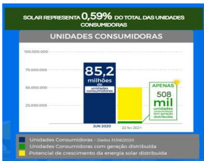
Gráfico elaborado com dados da Fonte Aneel