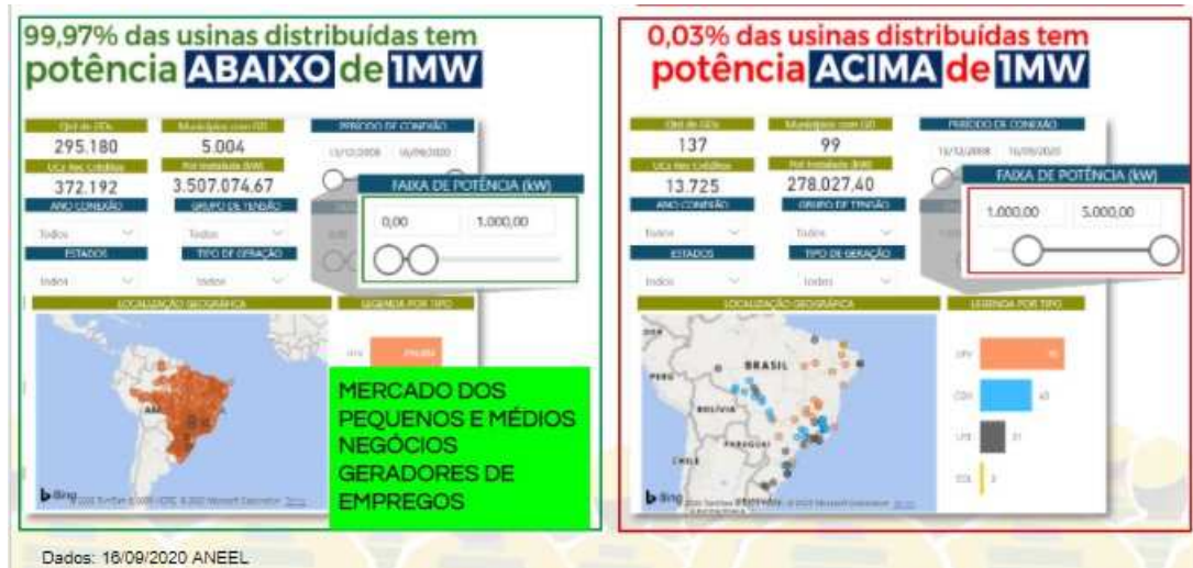
Gráficos e dados retirados do site da Aneel