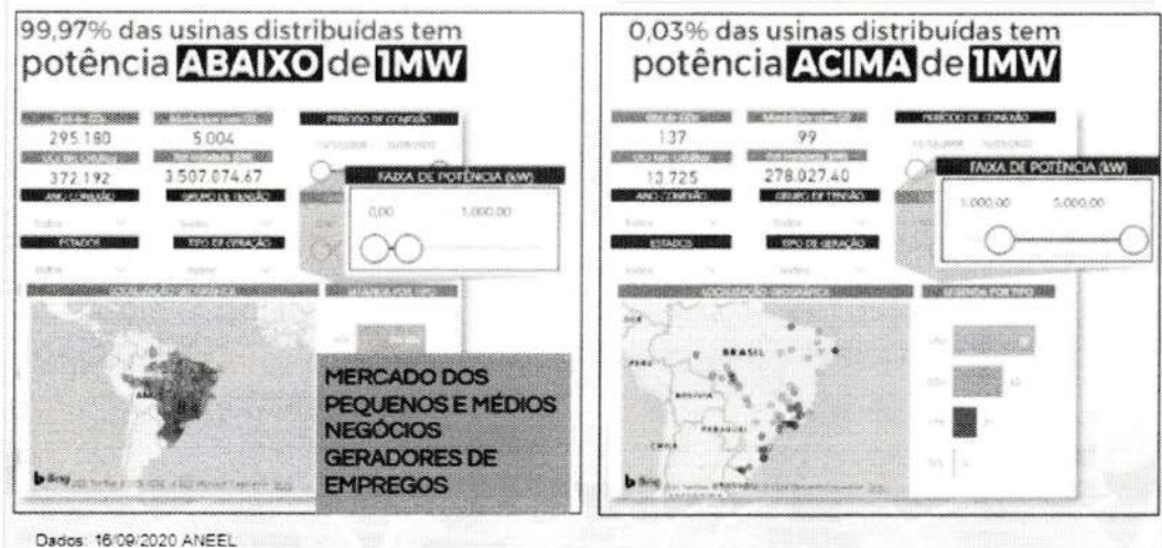
Gráficos e dados retirados do site da Aneel