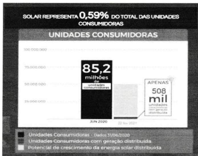
Gráfico elaborado com dados da Fonte Aneel

Ulisses Guimarães Eng.º Civil - Inspetor Chefe Inspetoria de Teófilo Otoni CREA/MG